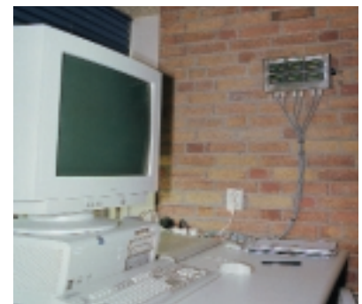
Contador por 3 líneas de rompimiento CEM 432 con 3 doble-cargadores tipo CAL 216/2