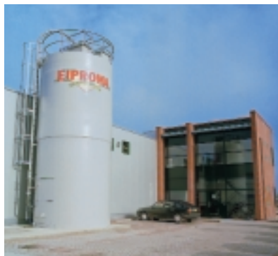
Nueva fábrica de Eiproma

no fue una elección difícil por Eiproma, gracias a su larga y positiva experiencia con los equipos Coenraadts. Trabajar con estas máquinas, es trabajar con fiabilidad, facilidad y eficacia. Cambiando al equipo Coenraadts, Eiproma pudo reducir su equipo de trabajo de un 20%.